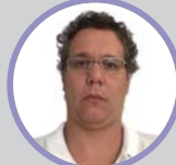
Dir. Promoções e Eventos