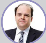
Dir. Relações Institucionais