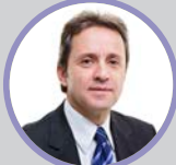
Dir. Planej. e Desenvolvimento